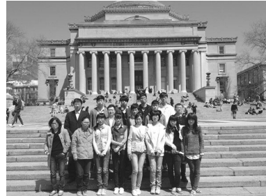
16日中午大家在哥伦比亚大学图书馆留影