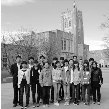
15日下午在新泽西州的普林斯顿大学图书馆前