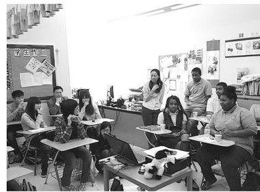
我校师生在 MTHC 的汉语课上