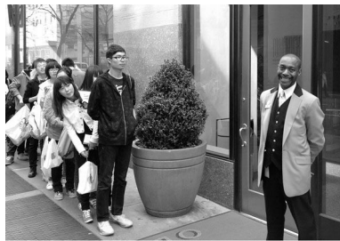
16日下午同学们在洛克菲勒中心外排队等候