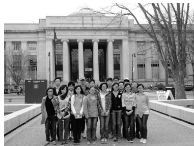
18日下午在麻省理工学院

离开哈佛,行车几分钟便来到了MIT麻省理工学院。我们参观了创建最早的主楼。许多学生社团在开展相关活动。看不出爆炸案在他们身上产生的影响。大家在门前拍照留念,而后驻足小憩。环顾四周,人来车往,一切那么和谐、安逸。我们也不敢想象这里是世界关注的焦点。下午四点多,我们乘车离开,前往郊外的下榻酒店。七个多小时后,在离我们休息地几百米的地方,爆炸案的嫌犯与警察交火,一死一伤。