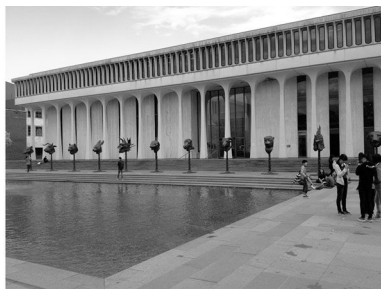
普林斯顿大学校园内展示的中国十二生肖兽首

16日,周二。全天在纽约。上午,途径世贸遗址,穿过曼哈顿,后乘游船参观自由女神像。上岸后经联合国总部,参观位于百老汇大街的哥伦比亚大学。下午,大家来到第五大街,体会美国最繁华的商业中心。这里有苹果旗舰店,有LV专卖店,应有尽有,人头攒动。接下来我们步行来到洛克菲勒中心,乘坐极速观光电梯,上到第67层,远眺中央公园,以及周边的高楼大厦。在这里,人们感受到纽约的庞大、拥挤、繁华和现代。