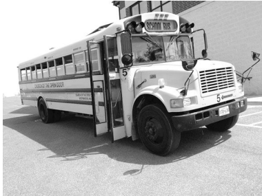
载我们奔波各地的 CCS 的 5 号校车